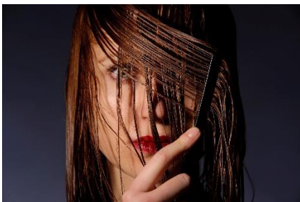
Eine Haarkur mit Kartoffelwasser sorgt für gesundes Haar und dunkelt erste graue Strähnen ab.

Kartoffeln gehören weltweit zu den drei wichtigsten Nahrungsmitteln. Erstaunlich ist dabei, dass sie zum Anbau weit geringere Mengen Wasser benötigen, als die meisten anderen Lebensmittel. So werden für ein Kilogramm Kartoffeln in Deutschland rund 135 Liter Wasser benötigt. Zum Vergleich: Ein Kilo Mais verbraucht während der Wachstumsphase rund 900 Liter Wasser, ein Kilo Reis sogar rund 2.500 Liter.