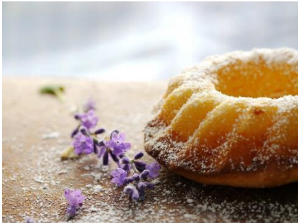
Zum Backen sind fein geriebene Kartoffeln ein guter Ersatz für Hühnereier