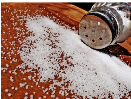
Zu viel Salz? Eine Kartoffel schafft Abhilfe

Kartoffeln enthalten so gut wie keine Pflanzenschutzmittelrückstände. Weder in der Schale noch in ihrem Inneren. Sie werden in Deutschland regelmäßig analysiert und auf Pflanzenschutzmittelrückstände getestet und unterschreiten dabei stets deutlich die erlaubten Höchstwerte. Somit ist die Kartoffel ein sicheres Lebensmittel und auch für Allergiker und empfindliche Mägen bestens geeignet.