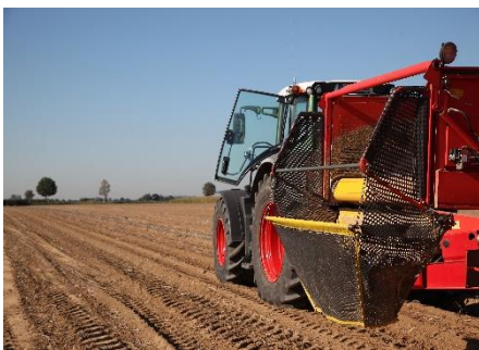
Sparsam: Für die Erzeugung von einem Kilo Kartoffeln wird rund 135 Liter Wasser benötigt.